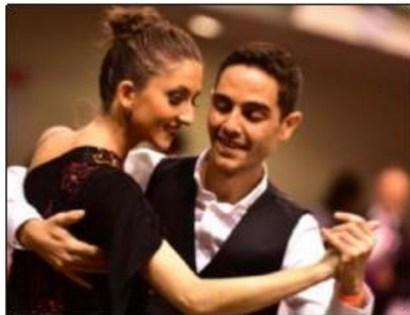
Le jeune couple est monté sur la première marche du podium.