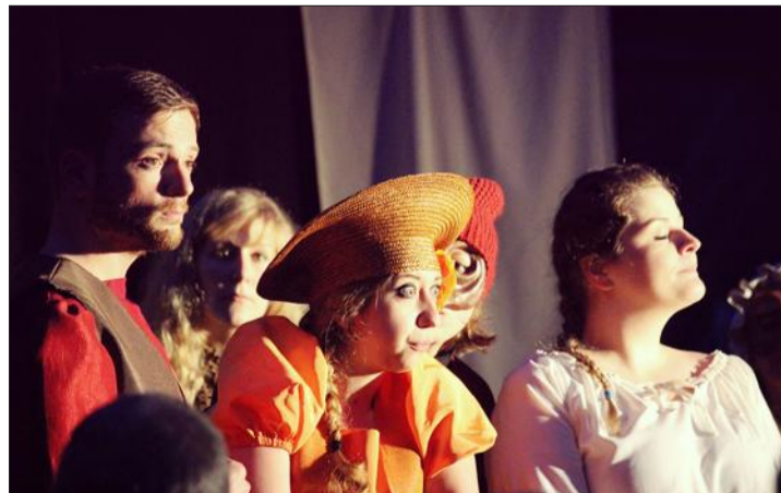
La compagnie Versatile joue la commedia dell'arte.

L'histoire. Pour améliorer son ordinaire et pouvoir manger à sa faim, Arlequin se montre rusé et sert deux maîtres à la fois. Seulement, les choses se compliquent car les deux maîtres logent dans la même auberge et se révèlent être les