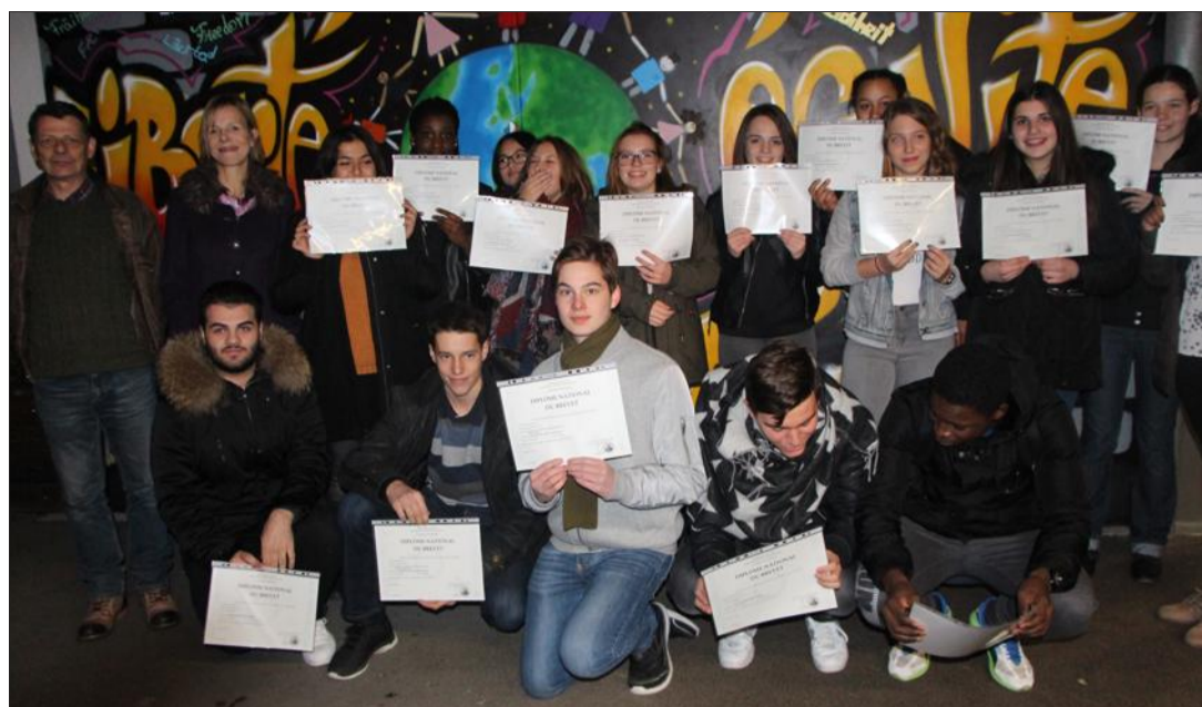
Des élèves ravis de présenter leur diplôme du brevet des collèges.

Les résultats globaux ont été très satisfaisants et stables avec un taux de 85,71 % de réussite,